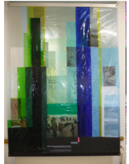
Hildegard Mahn, Nachhaltigkeit - Konsequenzen, 2011, Lehrte, Collage, transparent, beidseitig, PET-Folie, Plastiktüten, 1,36 x 100 cm