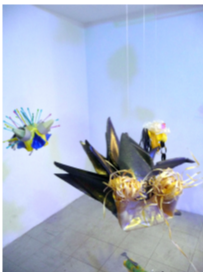
Anja Neimöck, Urtierchen, 2013, Bonn, Plastikflaschen, Plastikverpackung, Neun Stück je 50 x 20 x 45 cm. Jürgen Krauss, Ursound, Berlin, 2013, Soundcollage, 4:59 Min.