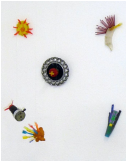
Hubi W. Jäger, Asphaltblumen, seit 1999, Berlin, Collagen, Plastik, Metall, Textil u.a. von der Strasse, 30 je ca. 15 bis 25 cm Durchmesser