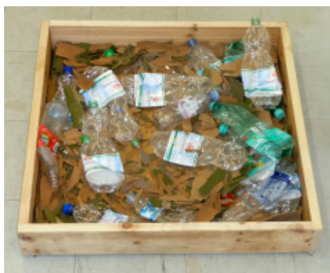
Tom Albrecht, You never walk alone, Berlin, 2013, Installation, interaktiv, Einwegpfandflaschen, Platanenrinde, Holzkiste betretbar, 81 x 81 x 13 cm