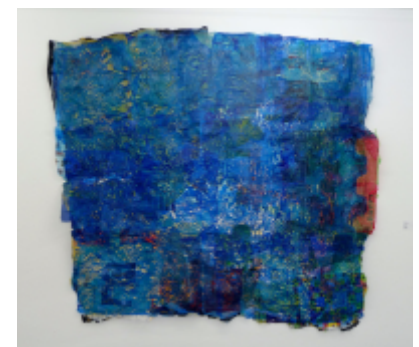
Ola Koziol, Rohöl Decke, Łódź (PL), 2013, Collage, Plastiktüten, 2 x 2,10 m