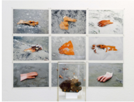
Karl Böttcher, S-P-O, Sankt Peter-Ording, 1997, Photos, je 30 x 20 cm, Objekt, Spielzeugauto, 20 x 20 x 140 cm, Am Strand gefunden