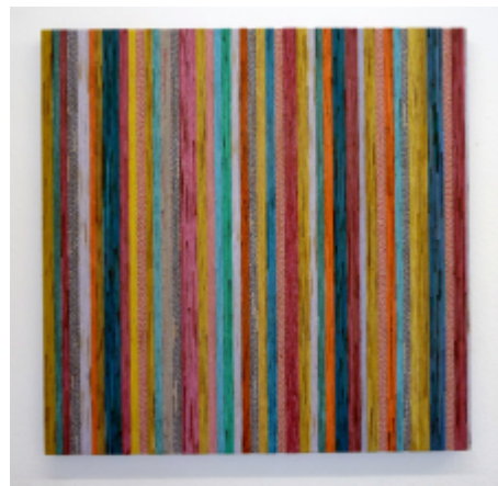
Burchard Vossmann, Kitchen-Stripes, 2009, Berlin, Collage, Küchentücher - Streifen auf Holz, 100 x 100 x 5 cm