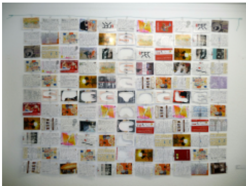
Pedro Bustamante, Spectacle, 2013, Berlin, Werbepostkarten, beidseitig beschriftet, 1,75 x 1,30 m