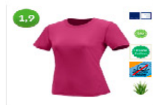
Vaude Womens Micro Mikeli III von Vaude 29,99 € bei Wildnissport