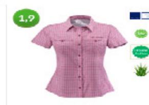
Vaude Shirt Women's Kungs Damen Outdoor-Hemd von 60 € bei hse24.de