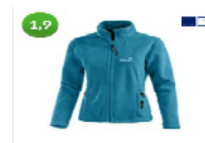
Jack Wolfskin Moonrise Fleecejacke Damen von Jack 69,95 € bei Sport Schenk