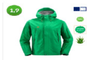
Vaude Men's Ortler Jacket Herren Allround-Jacke mit 119,95 € bei hse24.de